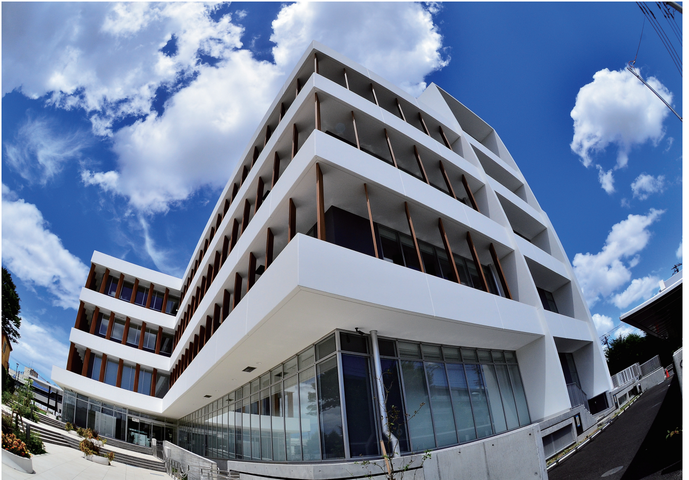
令和3年5月6日開庁の清瀬市新庁舎